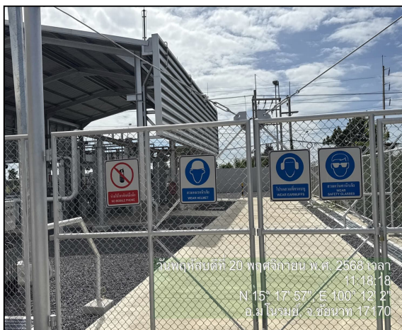
ป้ายเตือนความปลอดภัย