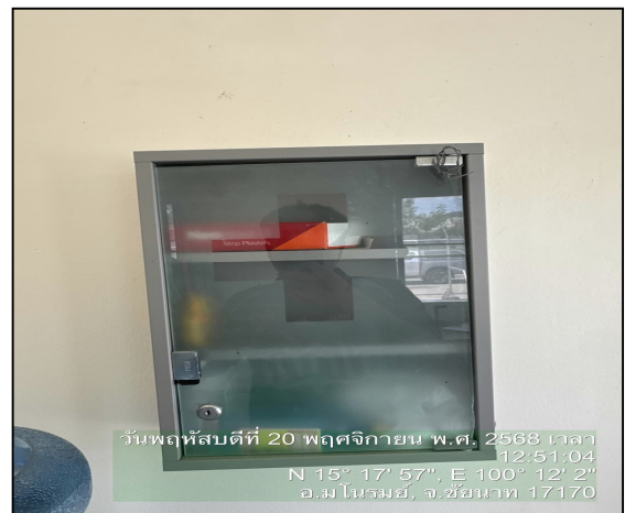
อุปกรณ์ปฐมพยาบาล

ภาพที่ 3.2-6 ภาพถ่ายระบบรักษาความปลอดภัยบริเวณสถานีก๊าซฯ โครงการวางระบบจำหน่ายก๊าซธรรมชาติไปยังนครสวรรค์ไปโอคอมเพล็กซ์