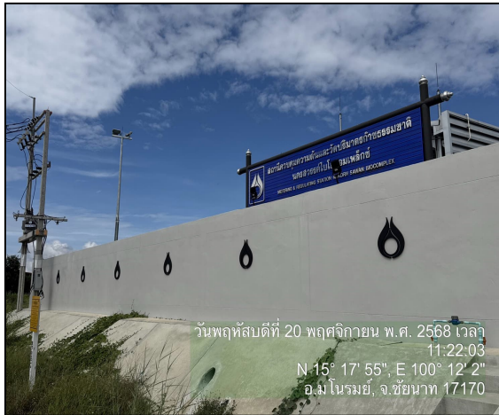
สถานีควบคุมความดัน