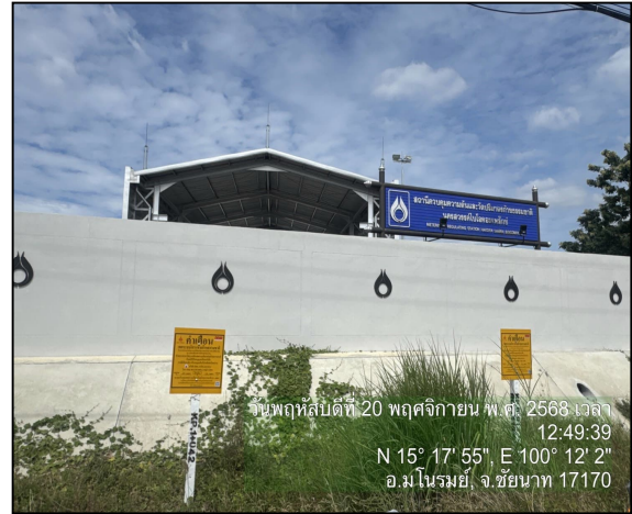
ป้ายเตือนแนวท่อส่งก๊าซธรรมชาติ