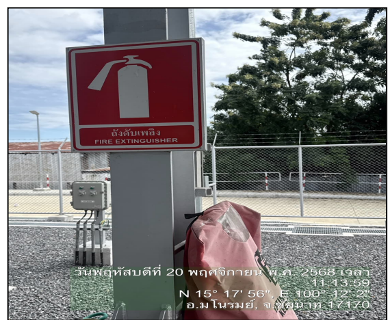
ถังดับเพลิง